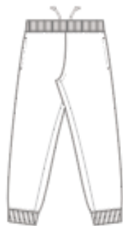
「パンツ(ユニセックス)」※UD・FD共通寸法