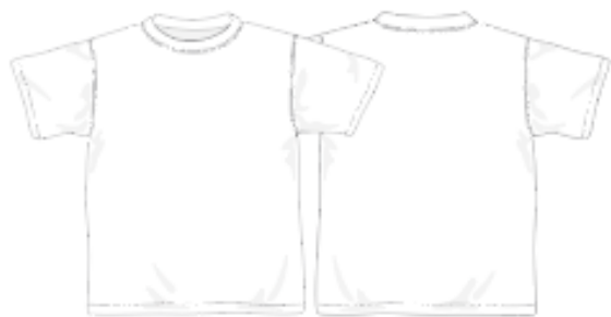
「Tシャツ(ユニセックス)」※UD・FD・RD共通寸法