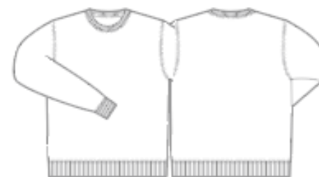
「トレーナー(ユニセックス)」※UD・FD共通寸法